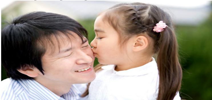
Tình cha ấm áp như vàng thái dương Ngọt ngào như dòng nước trôi đầu nguồn