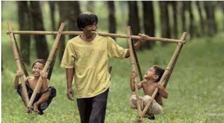
Hãy nhớ lời cha sống cho nên người, và con ơi chớ bao giờ dối gian. Nghèo thì cho sạch rách sao cho thơm.