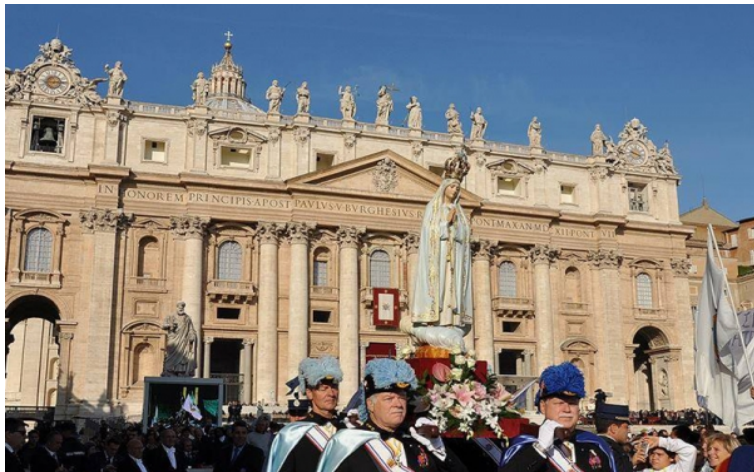
Đức Thánh Cha Phanxicô chủ sự cuộc Rước Tượng Mẹ Fatima tại Công Trường Thánh Phêrô, Roma.

Họ cũng phải “dâng lên Thiên Chúa là Đấng giàu lòng thương xót với niềm tin, qua sự chuyển cầu của Đức Mẹ Maria, những lời cầu nguyện, những đau khổ hoặc sự hy sinh của họ trong đời sống.”