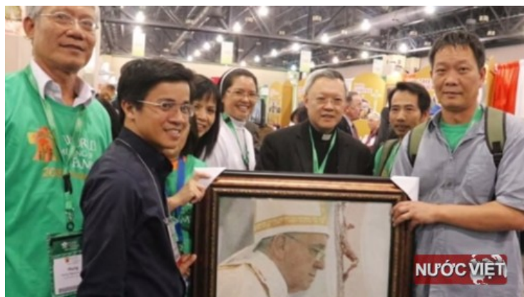
Bức chân dung Đức Giáo Hoàng bằng gạo Việt Nam

Trong những ngày từ 22 đến 25 tháng 09 năm 2015 tại trung tâm Philadelphia, có thể dễ dàng nhận thấy người Việt có mặt khắp nơi tại Đại Hội Thế Giới Về Gia Đình.